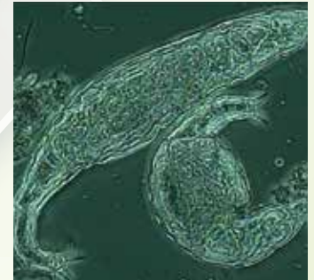
クサガメの甲羅から検出された藻と微生物

池、河川、海中、田んぼのプランクトンの観察をすることもできます。環境問題に取り組む団体・ワークショップなどで感動的な体験を!